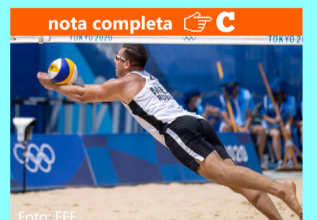
Termina el sueño mexicano en voleibol de playa