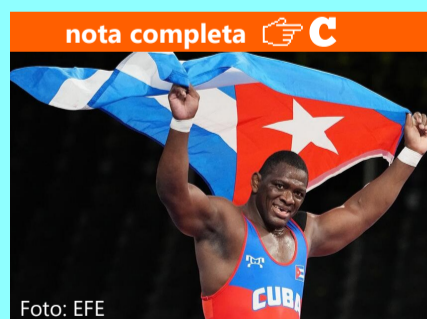
Mijaín López, el cubano de oro en lucha grecorromana