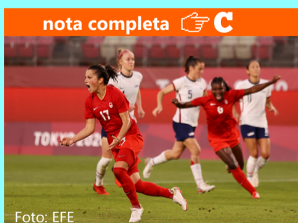
Canadá acaba con maldición y se medirá a Suecia