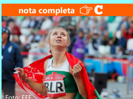
Polonia otorga asilo a atleta de Bielorrusia